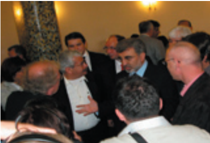
TBMM'de, Enerji Bakanı Taner Yıldız'la buluşma (sağdan ikinci; onun solunda Ufuk Uras).

Süryani cemaati temsilcilerinden bilgi aldı. Gazeteciler Programı 2005 yılından beri Türkiye Almanya Kültür Forumu ve Robert Bosch Vakfı tarafından düzenleniyor. Gelecek programa katılmak isteyenler aşağıdaki adrese başvurabilir: journalistenprogramm@das-kulturforum.de