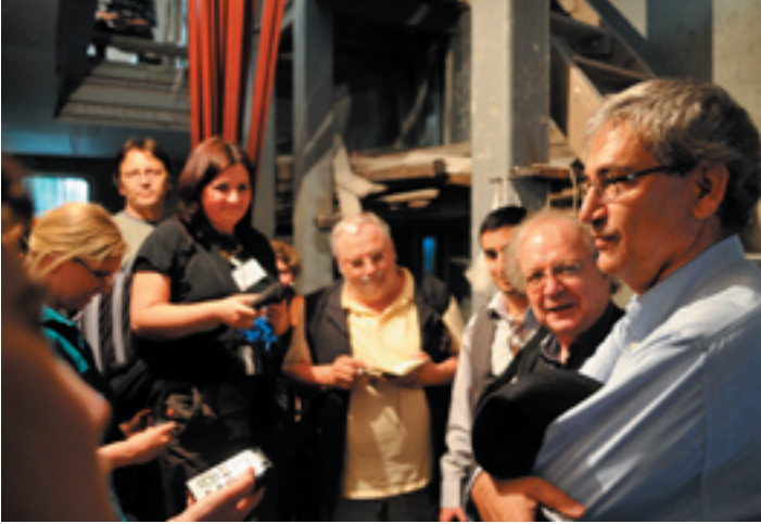
Orhan Pamuk'la "Masumiyet Müzesi" şantiyesinde.