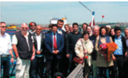
2010 Gazeteciler Programı katılımcıları KESK Haber Sendikası temsilcileriyle,

fırsatı buldu. Alman gazete, radyo ve televizyonlarından 16 gazeteci, 2010 Kültür Başkenti'nde haftalık Ermeni gazetesi "AGOS" ve günlük "Cumhuriyet" gazetesi çalışanlarıyla konuştu. Ankara'da, TBMM'de, bağımsız milletvekili Ufuk Uras, BDP milletvekili Sırrı